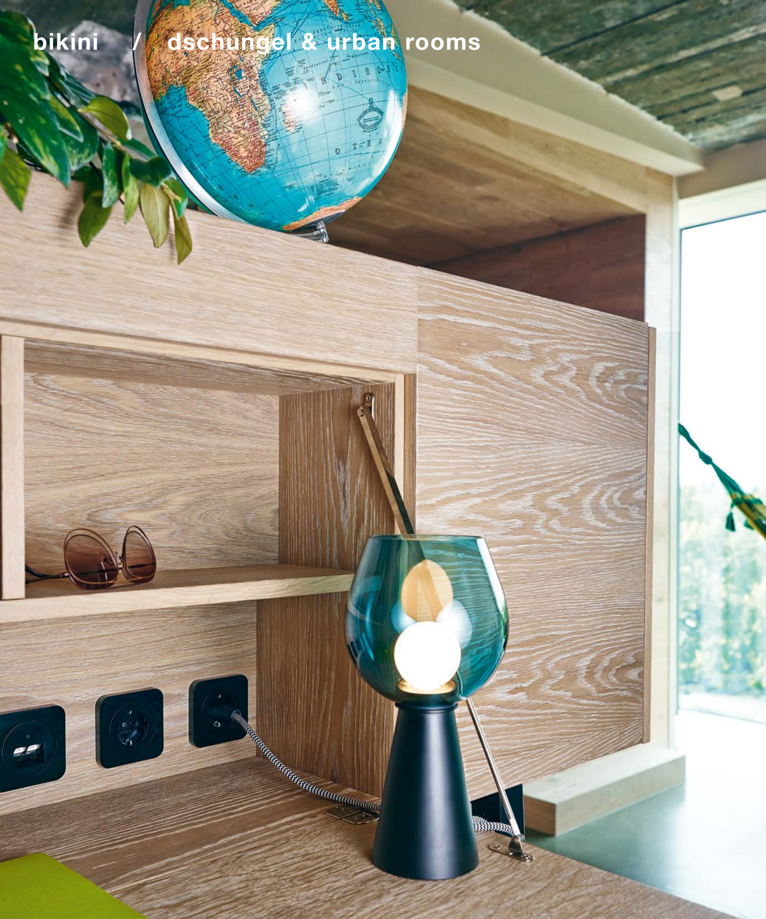
Der Berker R.1 sorgt im ganzen Haus für besten Anschluss zu Strom und Daten. The Berker R.1 ensures the best connection throughout the entire building.